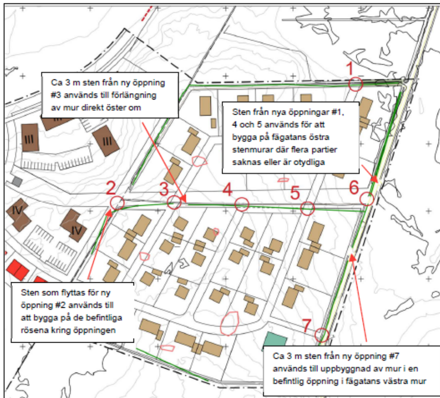
Figur 5. Platser där de stenmurar och odlingsrösen som måste flyttas kommer att återuppbyggas.