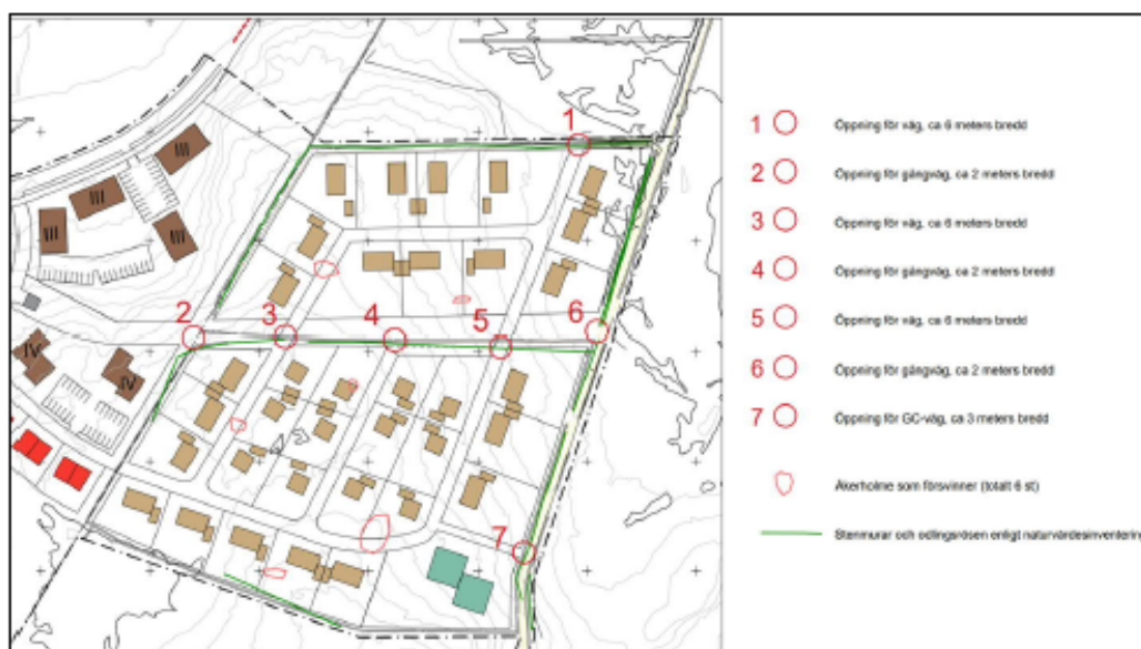
Figur 4. Del av detaljplan för utbyggnadsetapp 1 med markerade nya vägöppningar i stenmurar och odlingsrösen.